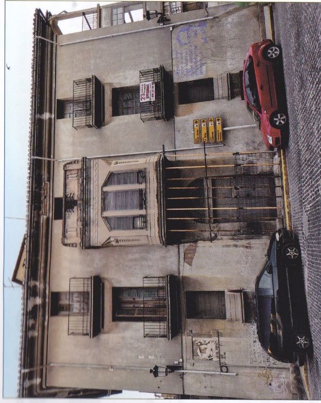
Requena-casa rótulo Negrín

el que anunció la pérdida de Barcelona. Según las informaciones que hemos recogido en distintas fuentes periódicas, el rótulo fue terminado de restaurar en el año 2019. El color actual se ha conseguido analizando los pigmentos utilizados en el rótulo original. Nos parece sorprendente que haya podido llegar a nuestros días y esperamos que no sea vandalizado.